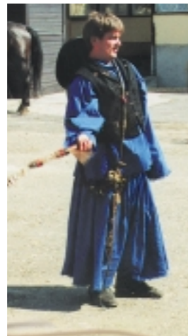
Bőgatyás, fekete kalapos csőszfiú próbálgatja az ostor csattogását 2001-ben a központi iskola udvarán.

A régi falusi élet egyik legszínesebb mulatsága volt a szüreti bál. Nagy készülődés előzte meg, melyben a fél falu résztvett. Rendszerint egy jómódú fiatal házaspár töltötte be a bíró szerepét, a költségek jelentős részét is ők állták. A gyülekező fiatalokat felpántlikázott lovaskocsik várták, ezekre kapaszkodtak fel a csőszlányok, csőszlegények. A betyárok lóra ültek, hangosan kurjongatva, ostoraikat patogtatva, énekelve járták be a falut. A lányok nem maglódi viseletbe, hanem magyar ruhába voltak öltözve: fehér ráncos szoknya, piros pruszlik, kötő, a fejükön gyöngyös-flitteres párta, hajukban szalagok. A férfiak bőgatyában, bőűjjű ingben, pitykés mellényben feszítettek, pörge kalapjukat ugyancsak felpántlikázták, árvalányhajjal díszítették. A csőszök figyelték, ki lopja a szőlőt, akit rajtakaptak, fizetnie kellett. A cigánynak öltözött maskarák gyalog járták az utcákat, bolondozásukkal szórakoztatták a népet. A zenét a trubacsok szolgáltatták. A végállomás rendszerint a Kruty-kocsma volt, ahol szőlősátor alatt folyt tovább a mulatság, énekeltek, táncoltak reggelig.