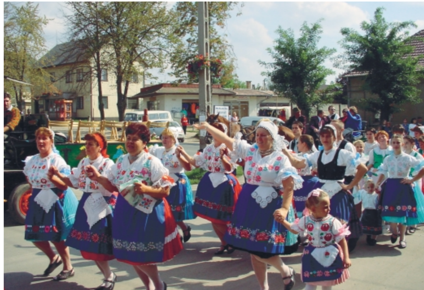
Szín pompás maglódi népviseletben megérkezik a táncosok egy csoportja a polgármesteri hivatal elé...