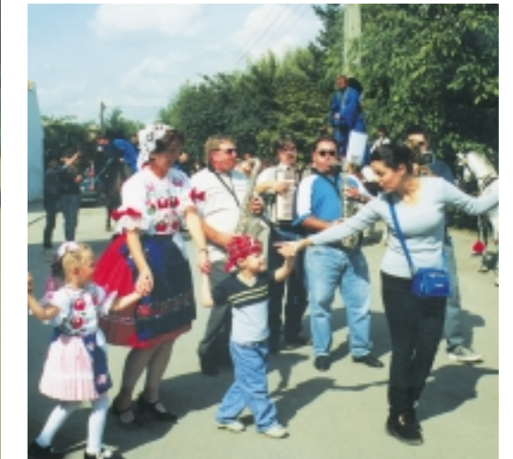
A talpalálós muzsikát ezúttal a kókai zenészek szolgáltatják. A legfiatalabbak most ismerkednek a szüreti balon szokásos táncokkal.