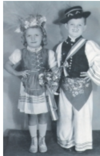
Két óvodás, szüreti bálos jelmezből 1954-ben.