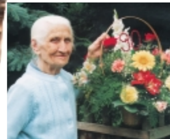
...és hetvenhat év múlva 90 éves korában, már az új évezredben: 2001-ben