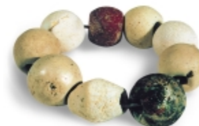
Különböző anyagokból fűzött gyöngyök, 2000 évesek lehetnek. a „Nagyhid” mögötti területről kerültek elő.