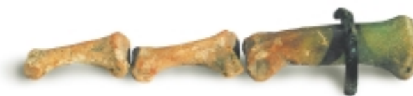
A szarmata sírban talált ujjpercen nyomot hagyott a rézgyűrű. Ez a gyűrűs ujjperc egy tömegsírban került felszínre.