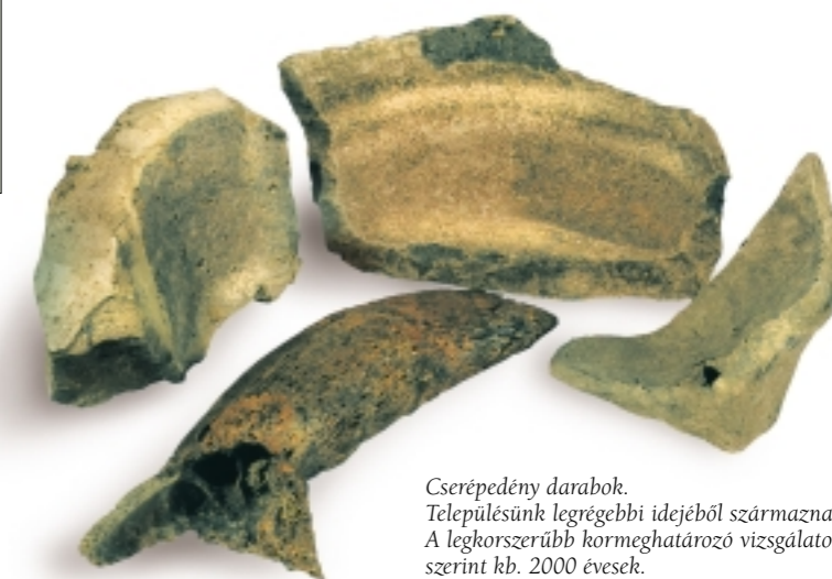
Cserépedény darabok. Településünk legrégebbi idejéből származnak. A legkorszerűbb kormeghatározó vizsgálatok szerint kb. 2000 évesek.