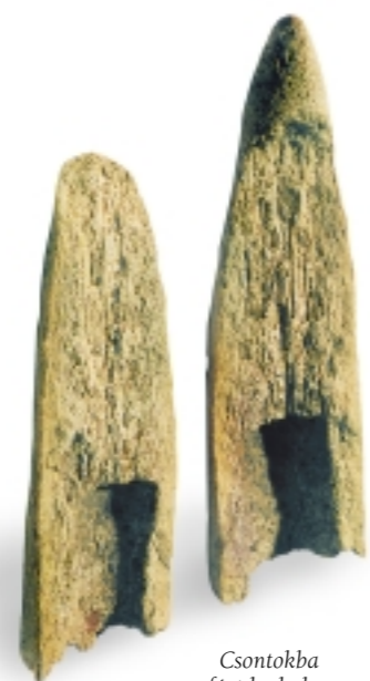
Csontokba fűrt lyukak. A paradicsomföldön talált lelet a honfoglalás idejéből származik.