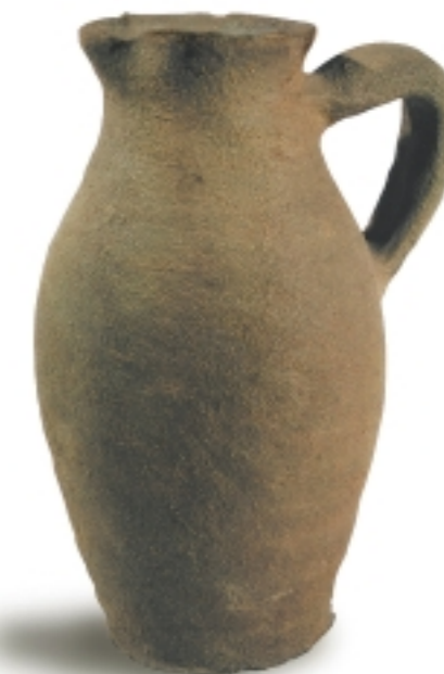
Az égetett avar korsó Kr. u. 400-500-as évekből származik