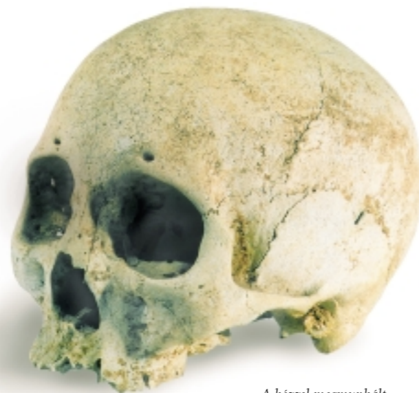
A kézzel megmunkált halotti urna (jobbra) és az avar kori ember koponyája a leendő maglói múzeum fontos értékei lehetnek. A véletlen és a szerencse összjátékának köszönhetően a hajdani agyagos (lőtér) löszhomokjából kerültek elő a leletek 1986-ban, amikor még senki sem sejtette milyen régiek.