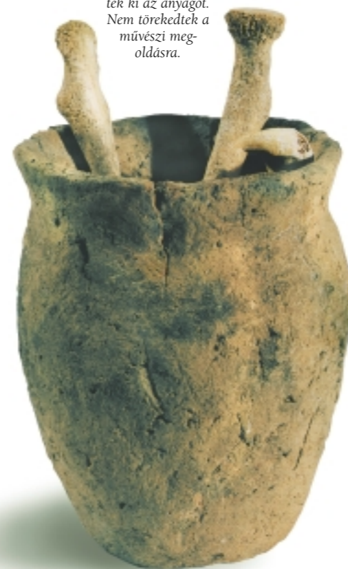
A temetés alatt a tűznél alkalomszerűen kiégetett edény. Ahogy lobogott a tűz úgy égették ki az anyagot. Nem törekedtek a művészi megoldásra.