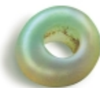
Átfűrt, szépen megmunkált kvarckő. A paradicsomföldön mezőgazdasági munkálatok során került elő 1982-ben.