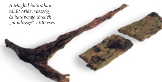
A Maglód határában talált óriási vasszög és karpengé töredék „mindössze” 1300 éves.