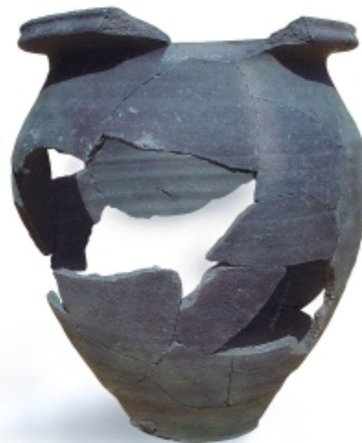
Égetett agyag váza. Az M0-ás autópálya-építkezés során került felszínre.