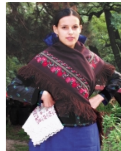
Hűvösebb időben a kacamajkára került a rojtos, himzett vállkendő. Alakja négyszögletes, kasmír anyagból, összehajtván háromszög formára, a hátán hátul átkötve hordták. Minden viselethez rátétként díszbékendőt viseltek, belehímézve a készítő monogramját.