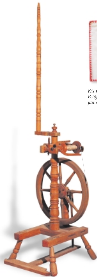
Rokka. Az előkészített kenderből ezen a furcsa szerkezeten fonták az asszonyok a fonalat. Ebből szőtték meg a vásznat, pamuttal keverve fehéreneműk részére, majd legvégül fehérítették.