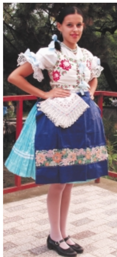
A lábukon pántos (splangis) cipőt viseltek