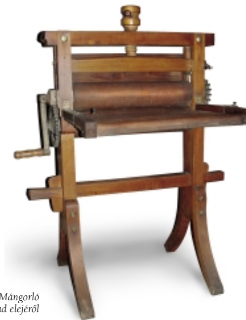
Mángorló a XX. század elejéről