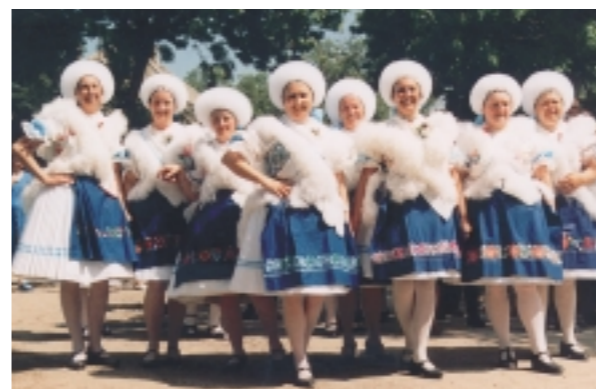
Menyecskek bujdos fejke tőben, pulykakendőben