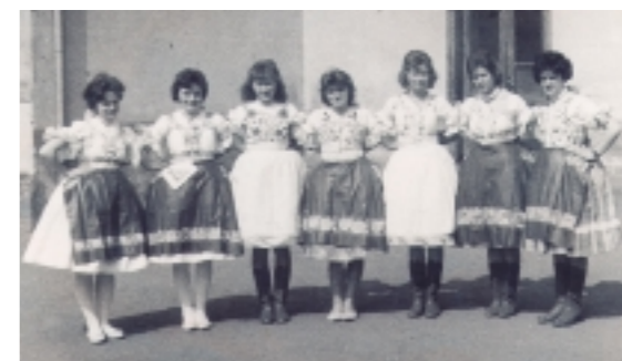
Hagyományörző lányok a hatvanas években készült felvételen