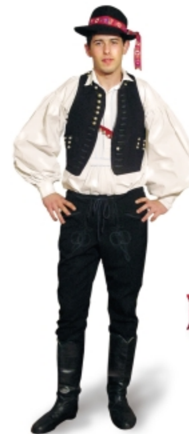
Férfi ünnepi viselete: Pitykés (lajbi) mellény rézgombokkal, fehér pamut- vagy vászoning. Posztó nadrág vagy rojtos szelű bőgatya, lábukon csizma. Fekete kalapjukon szalag, vagy virág.