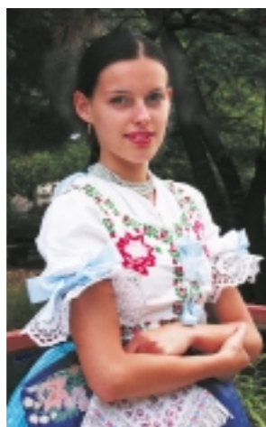
Fiatal maglódi lányok nyári viselete, melyet ünnepi alkalmakkor, bálba és a templomba vettek fel. Kézi himzésű népviseleti öltözet. A vászon alsószoknya felett hat selyem szoknya, (krumplikeményítéssel) keményített, rakott, himzett szoknya és kivarrott fehér pruszlik (mellény) volt. A sifonyanyagból készült kötényt glancolták (jényesztették).