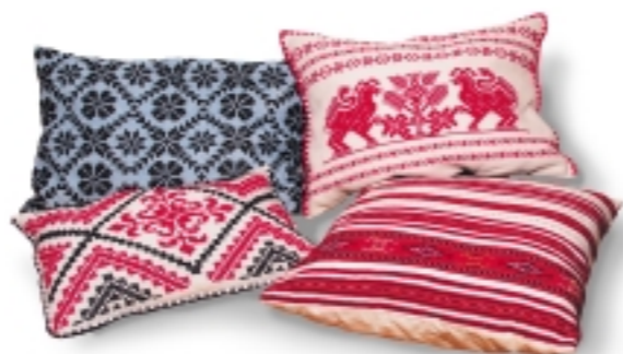
Erdélyi mintájú szőttés párnák