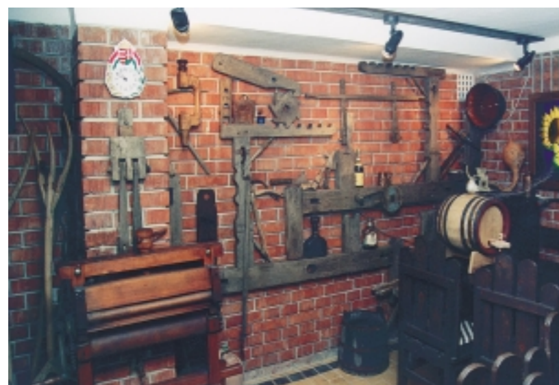
Egy parasztmúzeumnak berendezett borospince a nyaralói területen. A falon egy hajdani szövőgép darabjai, a kép bal sarkában csépfadarók és szénaforgató villák.