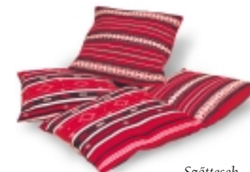
Szőttések egy gyűjteményből