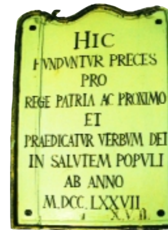
A szószerk feletti latin szöveg árulkodik a templom építésének idejéről