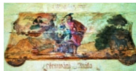
Ábrahám az Úr parancsára kész feláldozni fiát, Izsákot.