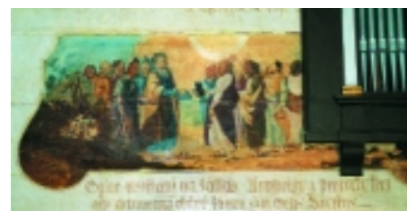
A deszkára festett képen az Ószövetség népe átadja a szentírást az Újszövetség népének