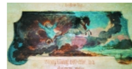
Illés tüzes szekerének ábrázolása a karzat freskóján.