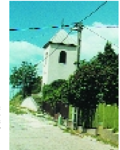
A harangláb az evangélikus parókia közelében különálló, négyzetletes alaprajzú, emeletes, vegyesfalazású, sátoztetős XVIII. századi épület. Fent mind a négy oldalon félköríves ablaknyílások vannak. Benne három harang bújik meg, a legkisebb 1723-ban készült.