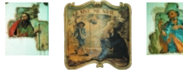
A szószerk képtördékei. Az épen maradt középső kép egy magvetőt ábrázol, a jobb oldali pedig Szent Péter ábrázolása a kulccsal.