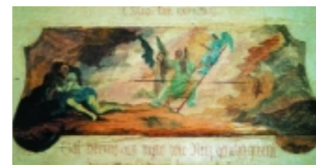
Jakob latorjája. Ahogyan a korabeli oltárképfestők elképzelték a menny és föld közötti mozgásokat.