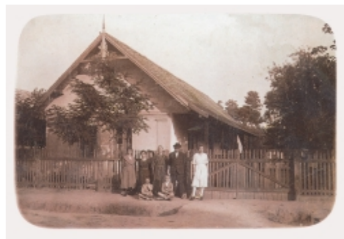
Szücsék háza a Wodianer úton, a háború előtti években