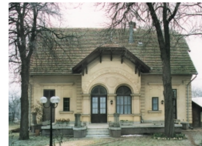
Egy szép régi villa a Sugár úton