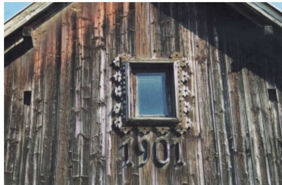
Az egyik legrégebbi deszkaoromzatos parasztház, díszített padlásablakkal. Kora mindösszesen 101 esztendő.