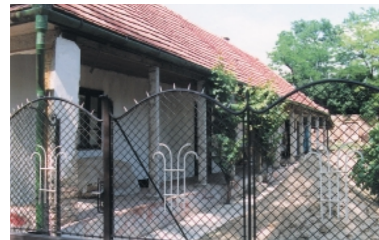
Jellegzetes udvar a Dózsa György úton