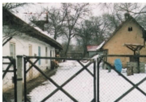
Parasztház a faluvégen