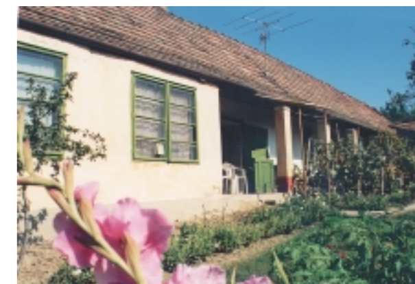
Az egyetlen szabadkéményes ház a Pakányi ház szomszédságában