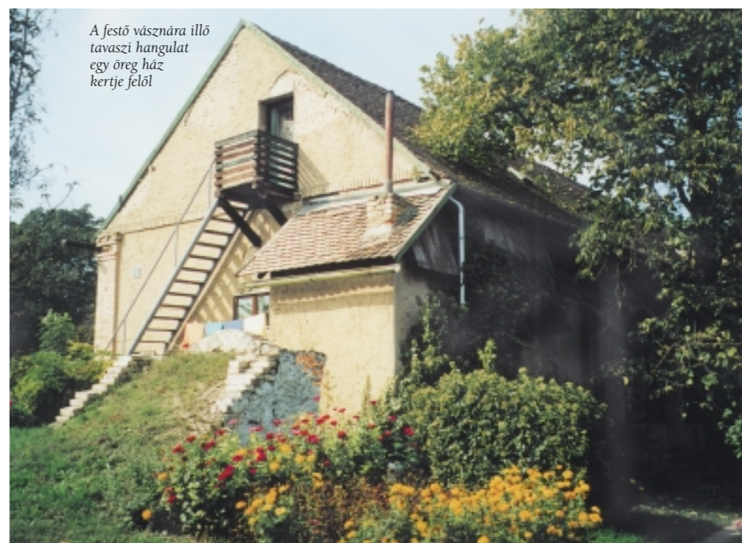
A festő vásznára illő tavaszi hangulat egy öreg ház kertje felől