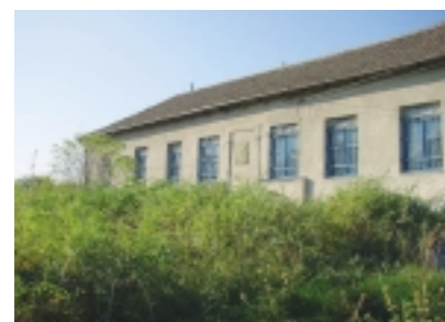
A Kőcán kúria keleti homlokzata. A szájhagyomány szerint ennek pincéjében ért véget az az alagút, ami az evangélikus templom kriptájából indult.