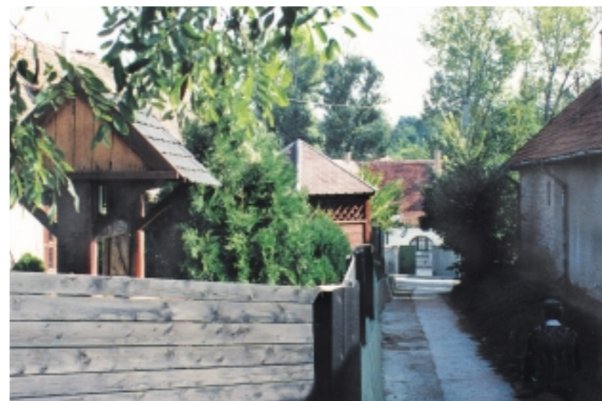
Az Ulicska utca vége, közel a Petőfi-téri iskolához